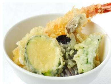
海老と野菜の天丼