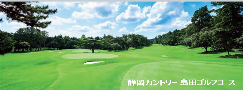
静岡カントリー 島田ゴルフコース

世界的名設計家リース・ジョーンズによる改修：浜岡コース(高松・小笠) / 島田ゴルフコース