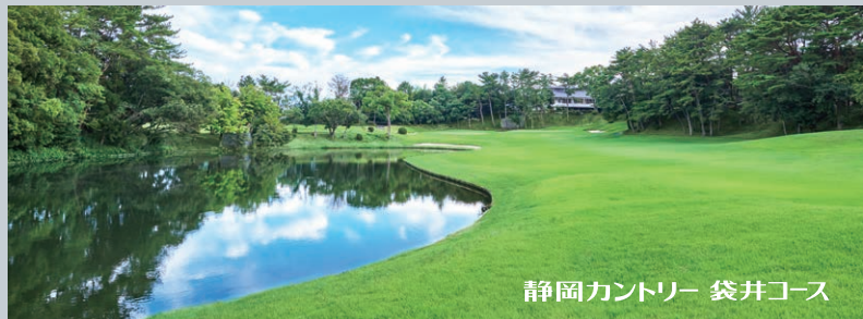
静岡カントリー 袋井コース